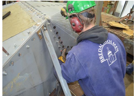
Klinking langs overgangen.