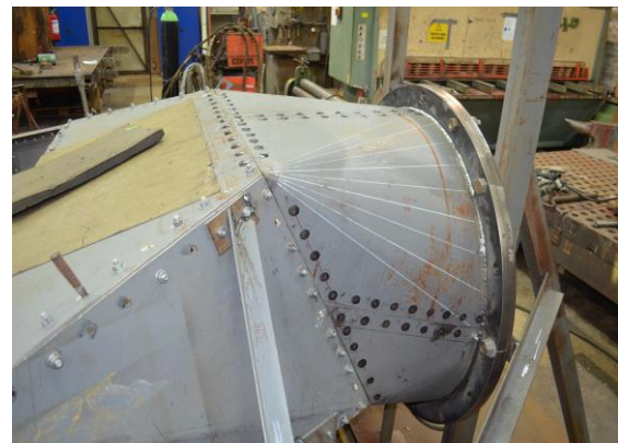
Toppen av røkopptaket med flens.