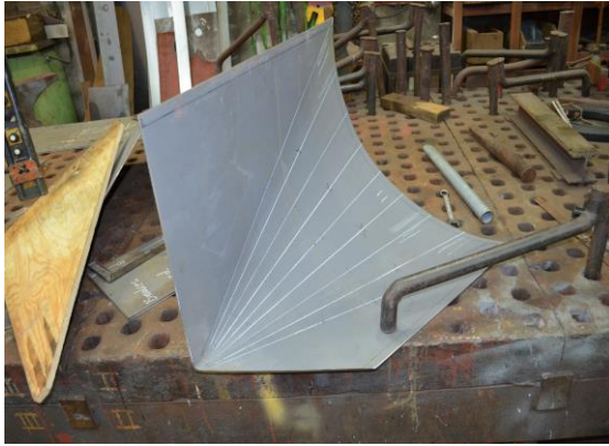
En av fire overgangsplater lages