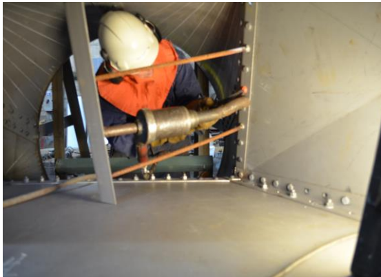
Luftmotholdet brukes under klinking