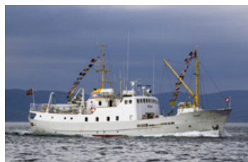
M/S «Gamle Mårøy»