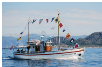
R/S «Ragnhild Schanke»