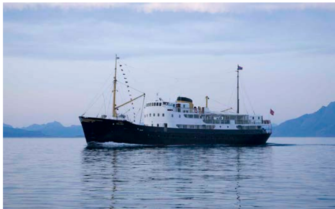
"Gamle Salten".

Som flaggskip for Saltens Dampskipselskab skulle det ikke spares på noe under byggingen. Da "Salten" ble levert fra Trosvik ble den omtalt som verftets "juvel". Salten ble bygd i stål og gitt en lengde på 53 meter (LOA), og en bredde på 8,5 m. Dybde i riss ble 5,66 m og bruttotonnasjen 627 tonn. Skipet fikk en svenskbygd Atlas motor med en oppgitt ytelse på 1140 hk ved 300 omdr., noe som ga en marsjfart på 13,5 knop. MS "Salten" var sertifisert for 180 passasjerer i liten kystfart og 290 passasjerer i lokalfart.